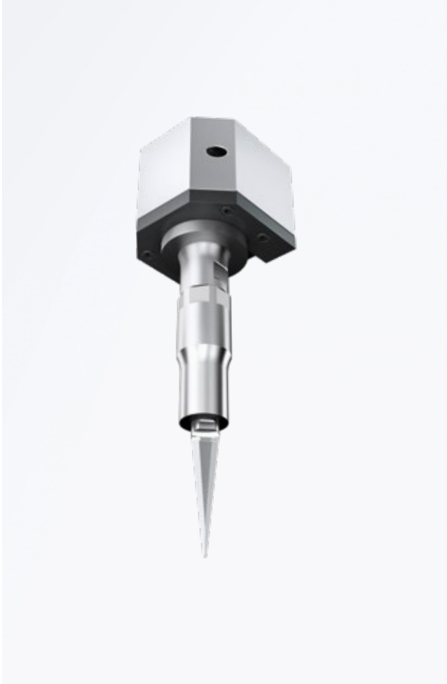
Robotik tesisler için hızlı deęiřtirme modüllu SonoTrans sistemi