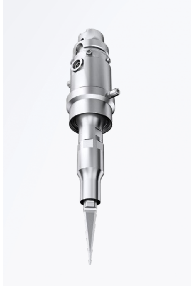
Takım tezgahları için HSK tutuculu SonoTrans sistemi